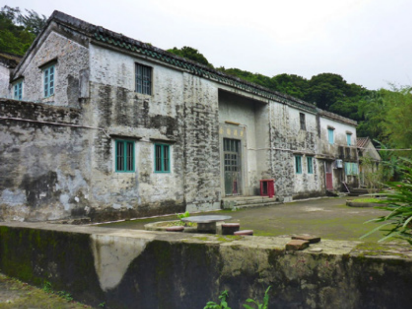
大嶼山鹿糊精舍 Luk Wu Ching She on Lantau Island