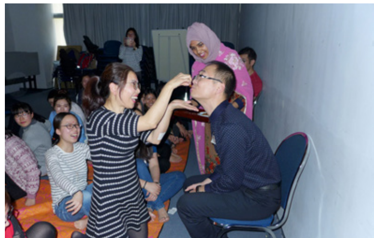
體驗文化衝擊的工作坊 A workshop to experience cultural difference

這是我第一次來香港，很高興能以這樣的方式，認識和了解這樣的香港。香港既不完全是TVB劇中看到的充滿時尚男女的摩登都市，也不完全是商品琳琅滿目的購物中心，也不是我聽人轉述中充滿冷漠偏見的商業社會。短短這幾天，我看到了一個很真實的香港，有人與人之間的包容和溫情，有尊重他人博愛萬物的情懷，也有人情理短的真实，有捉襟見肘的難堪，有不同族裔、不同階層、不同文化的衝突矛盾……這個城市裏的人與人，會通過各種方式相互連接，讓需要幫助的人或事得到關注與依靠，而不是孤單一人直面人生的坎坷和未來的窘迫。香港是一個豐富生動、充滿人情味的城市，於我而言，它已經不再是一個可以用簡單幾個詞被標籤化的地名。