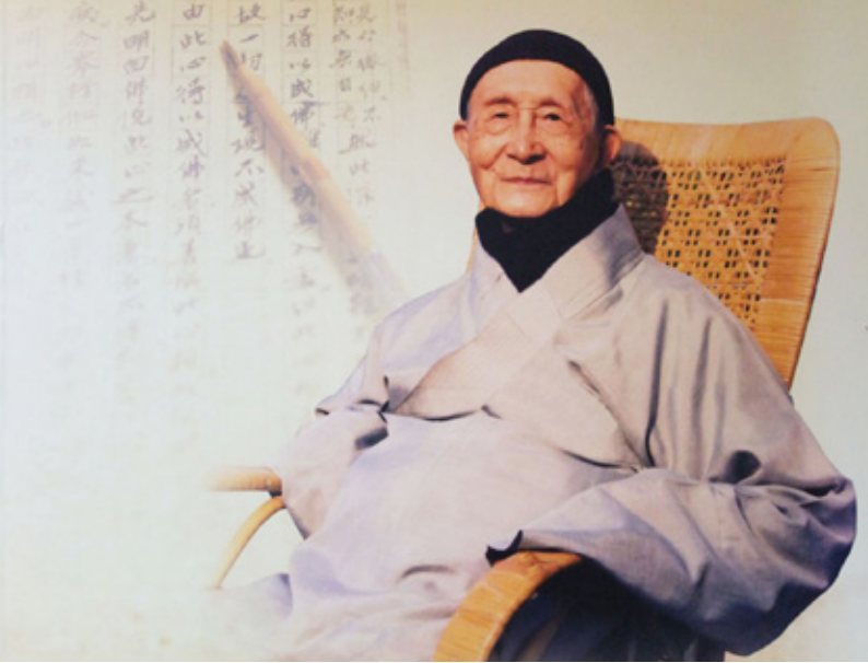
印順導師 Master Yin Shun