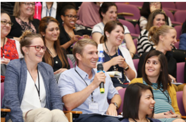
多位老師參與研討會的工作坊 Teachers attend a workshop during the conference

對於教育研討會的成果，呂博士說：「活動顯示我們學校在 21 世紀新型教學模式方面走在前列。我們現在實行的教學方法能夠全面培養學生，令他們在未來數年後面對未知的挑戰時獲得成功。我們的目標是，通過採用前瞻性的教學方式，爭取成為世界各國教育工作者的學習榜樣。」