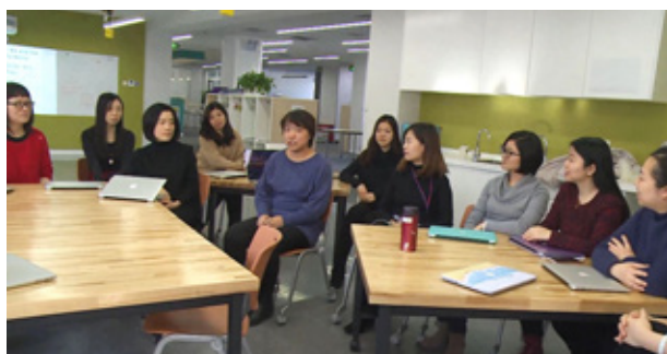
北京耀中領導力分享 A sharing meeting of YCIS Beijing

融匯中西文化的耀中耀華，全年也有各式圍繞西方文化的活動。香港耀中小學部首次舉辦橫跨三個校舍的國際日活動，結合不同文化背景的學生、家長、教師以及各種社會資源，讓學生能以一顆尊重和包容的心來認識和欣賞世界各地的不同文化。