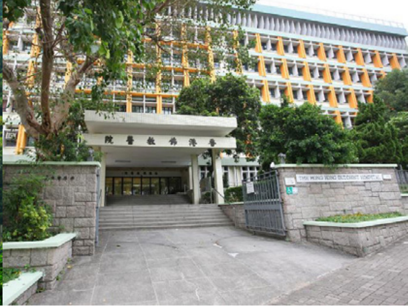
香港佛教醫院 Hong Kong Buddhist Hospital

年）、香海正覺蓮社（1945年）、香港佛教僧伽聯合會（1963年）等，肩負不同的社會責任。