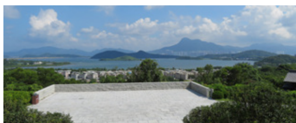
從山門可遠眺吐露港和馬鞍山 A view from the Main Gate

In order to promulgate the “Dharma” (the teachings of the Buddha), each building and even plantations in the monastery have their symbolic meanings in Buddhism. One such example is the 76-metres high, the world's second highest outdoor white towering bronze Guanyin statue. In Buddhism, Guanyin (Goddess of Mercy), who aspires to save beings from suffering, is a symbol of compassion.