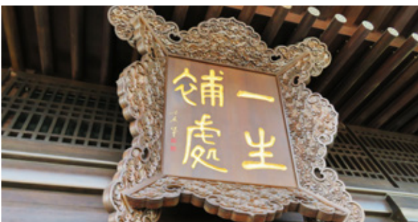
寺內到處可見由國學大師饒宗頤先生題字的牌匾 The words on the plaque are written by Chinese culture master Jao Tsung-i

寺院的一大特色，就是聳立了一座 76 米、全球第二高的戶外青銅合金白衣觀音像，即使身處馬鞍山，也能清楚遠眺之。在佛教中，觀音是慈悲的象徵，凡世間遭受苦難的眾生誠心念其名號，菩薩即可觀其音聲前來拯救，故名觀世音菩薩。慈山寺應和了大乘佛教的觀音信仰，可算為觀音道場。