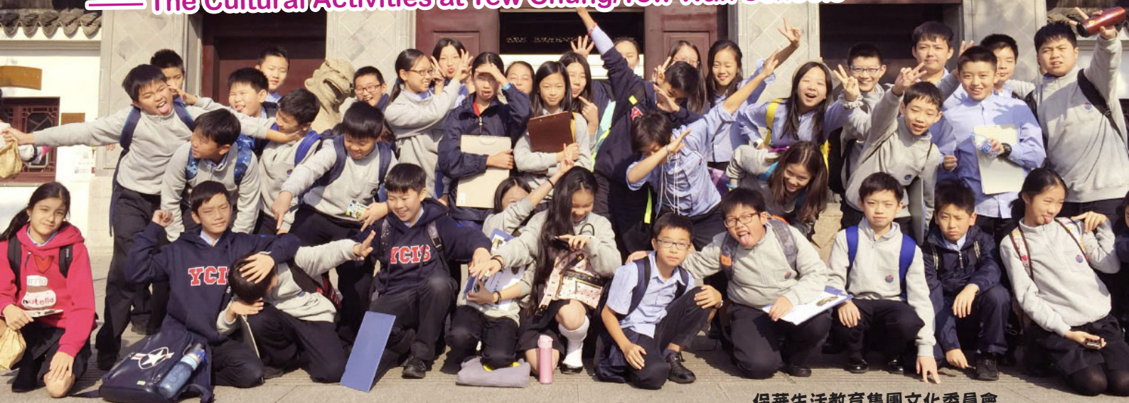
保華生活教育集團文化委員會 Culture Committee, B & P Group