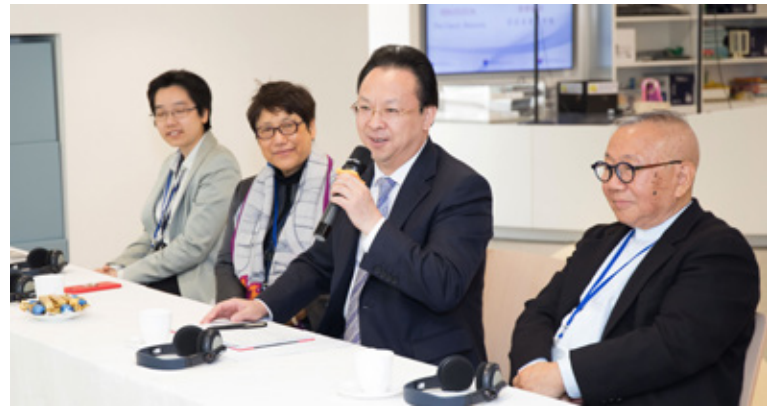
中聯辦副主任譚鐵牛(右二)形容耀中教育是「獨一無二」 Tan Tieniu (second right), Deputy Director of the LOCPG says Yew Chung's education is "unique"