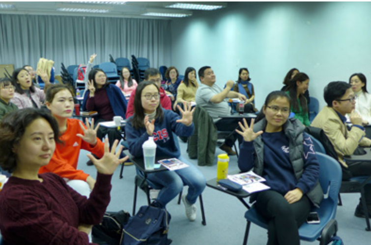
參加者在講座上回應講員提問 Participants respond to the presenter's question in a talk

從老師上述的回饋看出，本次活動達到了預期的效果，「知性之旅」能再次成功舉辦有賴負責此項工作的同事的努力和付出，謹此為他們點讚！