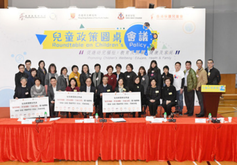
共二十多位幼兒教育與家庭照顧的專家和團體代表出席會議 More than 20 experts on and representatives of organizations of early childhood education and family care attend the meeting