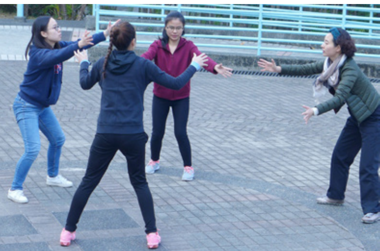
透過默劇表達環保意識 A mime to express environmental protection

第二天的「環保」 給我的印象與感受都是最深的。觀塘的實地觀察讓我看到一個急速發展的社會所帶來的一系列問題。人民的生活與社會的發展如何取得平衡、實現可持續發展？對每個人，這都是值得思考的問