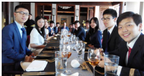
上海耀華古北校區實地教學活動 Students at YWIES Shanghai Gubei learn Western table manners

Through a series of activities during International Day, students learnt and appreciated the culture of different countries. In field trips and field study programs, students practiced what they had learnt. For example, students at YWIES Shanghai Gubei learnt Western table manners, starting with acquiring related vocabulary and ending with a formal meal at a restaurant.