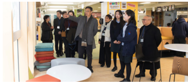
耀中學生引領來賓深入體會「學習社區」 Yew Chung students give a Learning Community campus tour to the guests