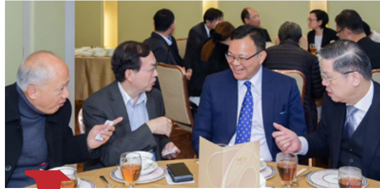
午餐會來賓在席間熱烈討論 Guests of the luncheon have a discussion during the meal

是，中國、俄羅斯等國並不買賬，你走你的陽關道，我過我的獨木橋。與此同時，經歷改革開放 20 年的中國，國力初見形成，在國際舞台上漸露頭角，於是，一些西方學者把中國發展經驗稱之為「北京共識」。然而，當時的中國政府自覺實力不夠，又想避免與美國同場叫板，傾向淡化此類說法。