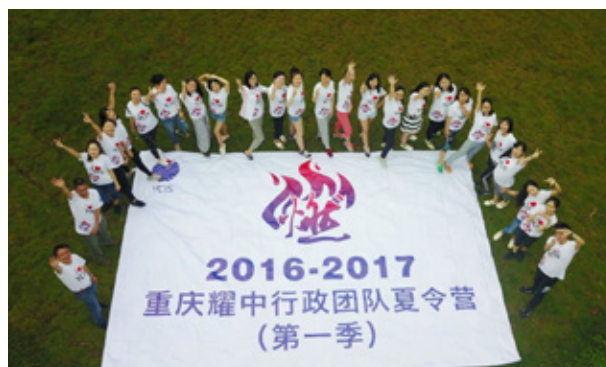
重慶耀中夏令營 A summer camp of YCIS Chongqing