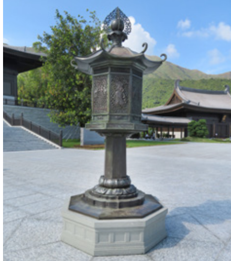
大庭院的青銅燈籠參照了日本奈良東大寺的金銅八角燈籠設計 A bronze lantern on the Grand Courtyard

慈山寺除了是供僧伽修行的道場外，還舉辦各式各樣開放給大眾參與的活動，包括開辦佛學課程、法會、青年夏令營、禪修營、出版佛學刊物，還有茶禪、行禪、抄經、供水等。禪是禪那 (dhyana) 的簡稱，靜慮的意思，透過禪修可讓參加者精神專一，進入禪定的狀態，能消除繁忙緊張的生活壓力，達到安頓心靈效果，以將佛教的修行融入到都市化的生活中。