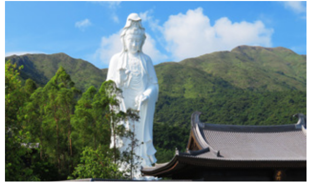
寺內全球第二高的戶外青銅合金白衣觀音像 The world's second highest outdoor white towering bronze Guanyin statue

寺院的一大特色，就是聳立了一座 76 米、全球第二高的戶外青銅合金白衣觀音像，即使身處馬鞍山，也能清楚遠眺之。在佛教中，觀音是慈悲的象徵，凡世間遭受苦難的眾生誠心念其名號，菩薩即可觀其音聲前來拯救，故名觀世音菩薩。慈山寺應和了大乘佛教的觀音信仰，可算為觀音道場。