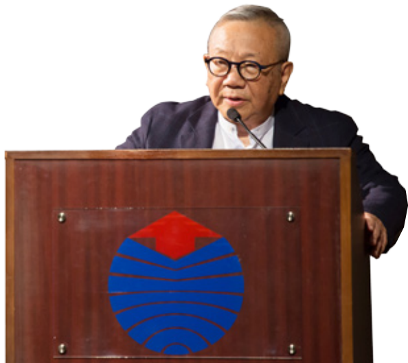
葉國華教授 Prof. Paul Yip Kwok-wah

金 (Stephen Hawking) 有關人類前途與關注太空的說法，指出教育要有「仰望星空，撫覽大地；萬種同根，愛是源泉」的胸懷。