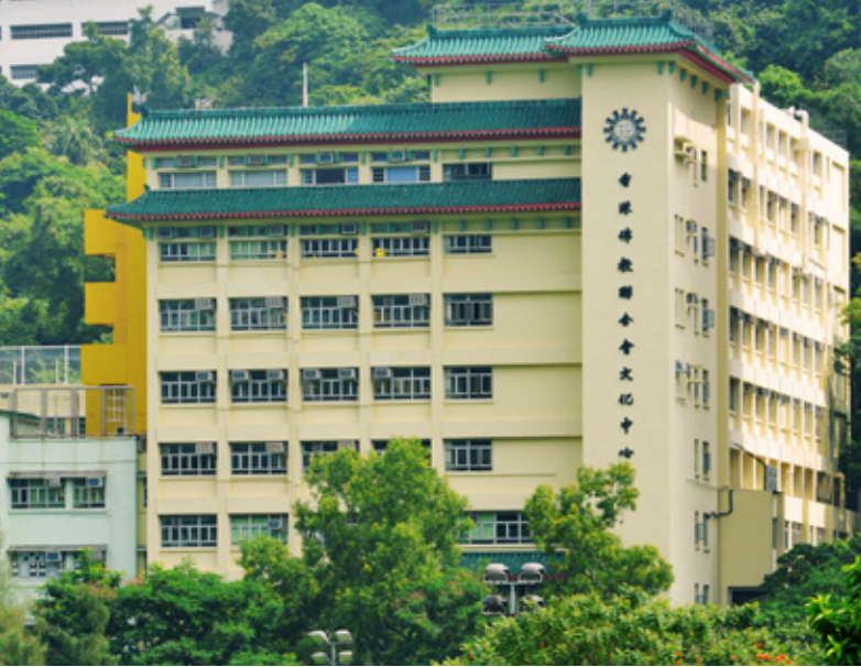
佛教黃鳳翎中學 Buddhist Wong Fung Ling College