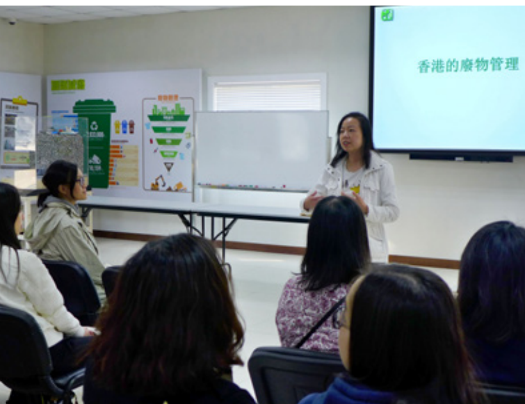
有關環保的講座 A talk on environmental protection

題。將軍澳的垃圾堆填區帶給我很大的震撼，沼氣、污水的再利用，堆填區的規模及再利用的思路都讓我感受到香港政府對環保的重視。後來，我利用自由活動的一天去了西貢的銀線灣，那裏的海域很美，但在沙灘上到處可以見到人類的生活垃圾，海面上也漂浮着各種塑膠製品等垃圾。這讓我覺得只有真正提高民眾的環保意識和環保責任，環保才能有效地落實下去。