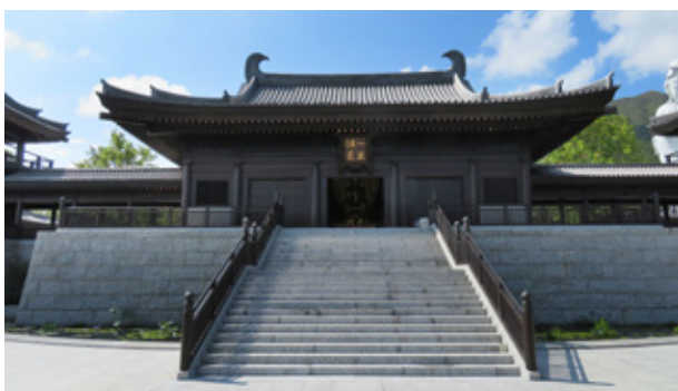
寺內彌勒殿，屋頂採單檐歇山頂樣式，兩頂端為鴟尾 Maitreya Hall

上世紀四〇年代，著名建築家梁思成與林徽因夫婦，為了證實中國仍保有唐代木結構建築，走遍了大江南北進行調查，結果在佛教四大名山之一的五台山，發現了中國現存第二古老的木構建築——佛光寺東大殿（建於公元857年）。慈山寺的主殿大雄寶殿即參照佛光寺東大殿為設計藍圖，屋頂樣式採中國古代建築中的單檐廡殿頂，是最高等級的屋頂形式。上世紀五〇年代，中國文物專家又在五台山發現了中國現存已知最古老的木構建築——南禪寺（建於公元782年）；慈山寺的彌勒殿即以此為設計藍本，屋頂樣式採單檐歇山頂，規格上僅次於廡殿頂，與大雄寶殿主次分明。慈山寺外表看來像是傳統木構建築，但其實建築的支柱使用了混凝土配合鋼材，外層以非洲紫檀木包裹，可謂兼具了傳統與現代的建築技術。