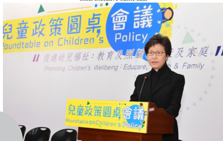
行政長官林鄭月娥 Chief Executive Carrie Lam