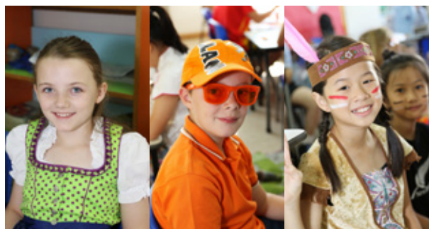
香港耀中國際日 International Day at YCIS Hong Kong

Yew Wah and Yew Chung promote global humanistic education and whole-person development. Utilizing the best of the East and West, schools teach the students the essence of civilization and help them make good use of it so that they become capable global citizens.