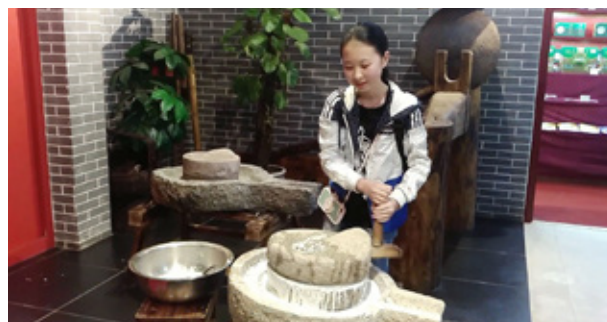
青島耀中中華體驗行 Experiencing China program of YCIS Qingdao

學生還可以走出課室學習，青島耀中一年一度的「中華體驗行」帶學生到桂林和杭州，了解基本的地域概況和民俗民風。上海耀中古北校舍七年級母語中文班的同學前往上海南翔的古漪園，為「江南園林」研習課進行了探訪研究活動。十年級學生在臨安的校外學習考察活動中，學習了一些在課室裏學不到的技能，包括雨中鄉間騎行、野炊、野營等。