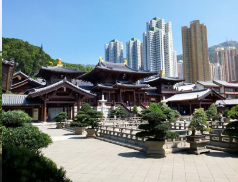
鑽石山志蓮淨苑 Chi Lin Nunnery in Diamond Hill

還開辦與推行慈善、醫療、教育、賑災、環保回收等濟世利生的事業，且把它們發展至世界許多地方。在中國大陸，佛教再度復興得較晚，但不少佛教團體與寺院近年除着手佛法弘揚與教育外，也開始從事社會慈善事業。