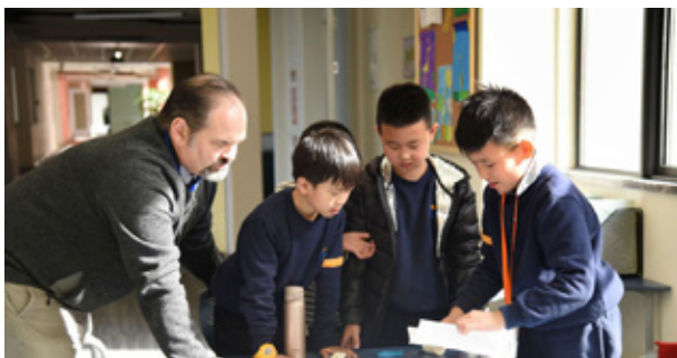
桐鄉耀華文化周 Culture Week at YWIES Tongxiang

耀中耀華推行環球人類教育，從培養全人的角度出發，融匯中西，建立自己獨特的文化，透過全年各式課程和活動，教導學生文明的精粹，幫助他們學以致用，讓知識延伸到生活中，為未來培育內外兼備的世界公民。