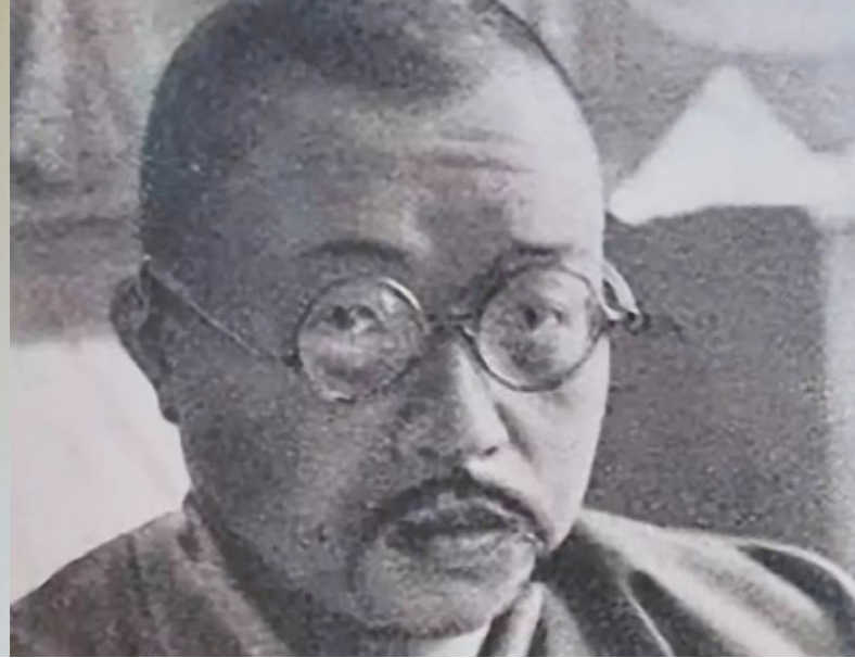
太虛大師 Master Tai Xu

Humanistic (human-world) Buddhism which has developed over the past 100 years is now quite popular on the two sides of the Strait. The movement of Humanistic Buddhism, started by Master Yin Shun (1906-2005), advocates helping others both spiritually and materially to enhance their wisdom and welfare. Nowadays, many Buddhist organizations in Taiwan, Hong Kong and on the mainland actively engage in these two aspects of the Bodhisattva Way.