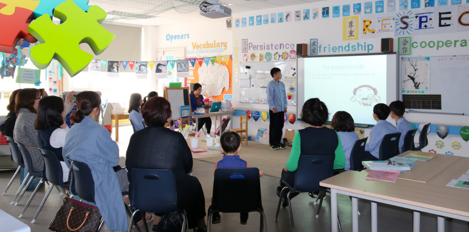
分享學習 Student shares what he has learnt