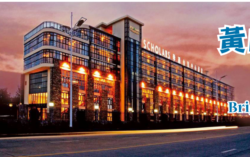
學而酒店整體外觀 Scholars Conference Hotel