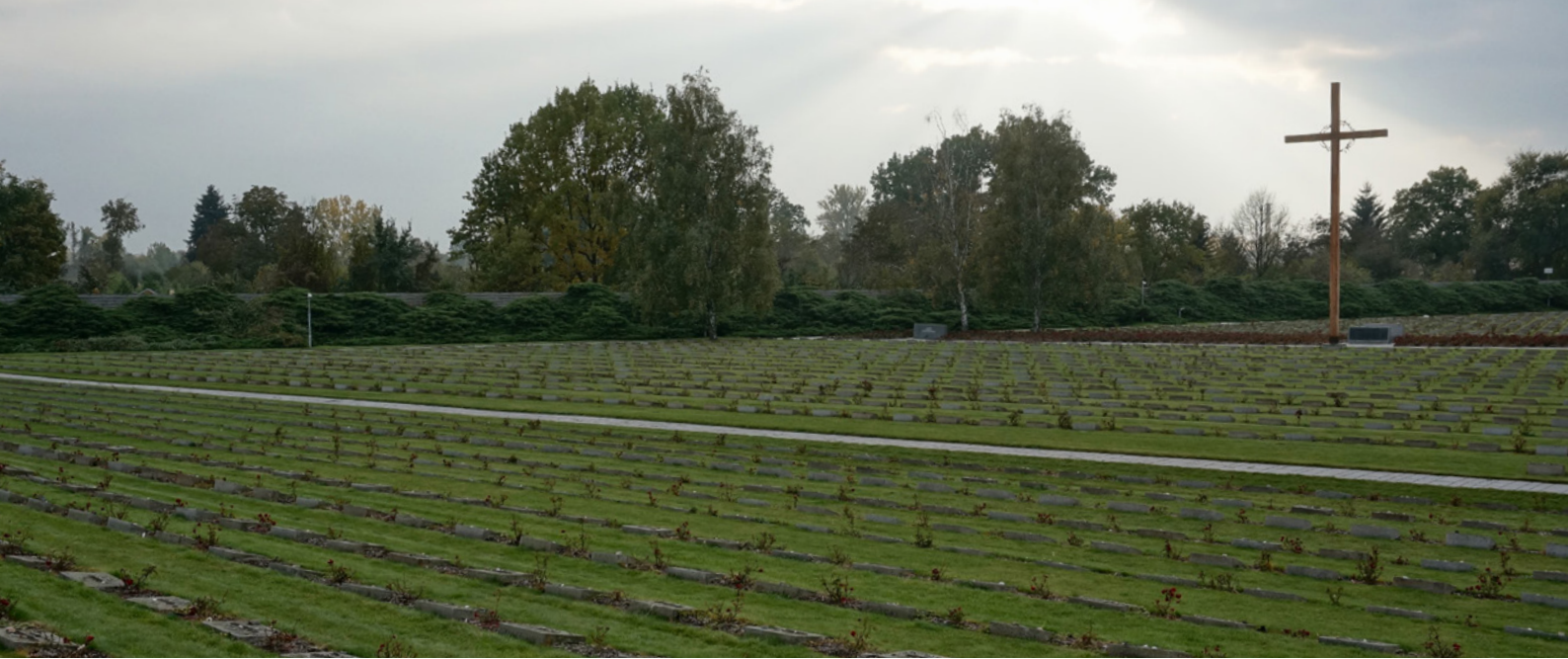
國家公墓 National Cemetery

其中，泰雷津集中營是「主題 B：猶太民族與第二次世界大戰」的主要考察點。誠然，第二次世界大戰是課程的重要部分，但是對我們來說，選定這個主題有更為重要的理由。考察的時候，我們站在大屠殺紀念館，每一面牆上都密密麻麻地爬滿了手寫的死難者名字，數之不盡。一個又一個名字無聲地盯着我，我卻似乎聽見震耳欲聾的吶喊聲。這樣的震撼深植於心，驅使我們到處翻查有關大屠殺與泰雷津集中營的資料，同時不斷思索埋藏其中的教訓。我們相信，這是一段屬於人類的歷史，我們承擔着其中的罪惡與救贖、苦痛與希望、仇恨與愛；把學生帶到歷史現場，引導他們關心屬於世界的苦難，是「培養孩子成為世界公民」的理念之體現。