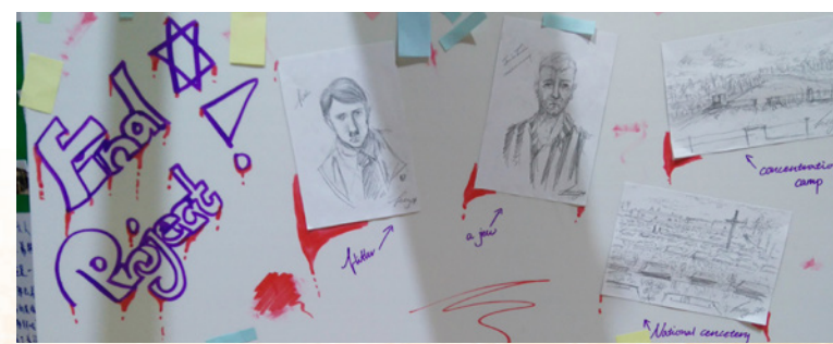
學生素描的希特拉、猶太人、集中營和國家公墓 Sketches of Adolf Hitler, Jewish, a concentration camp and the National Cemetery by students

Nothing speaks better than the heartfelt diaries of the students written during the trip. As I read through their daily reports filled with compassion and insight, I felt that all our hard work has paid off. The world has never been, and will never be perfect, but what truly matters, is that we are striving to make it a better place.