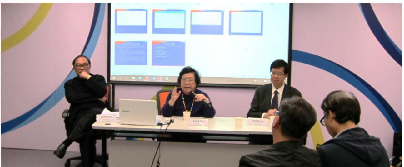
答問環節 Q & A Section