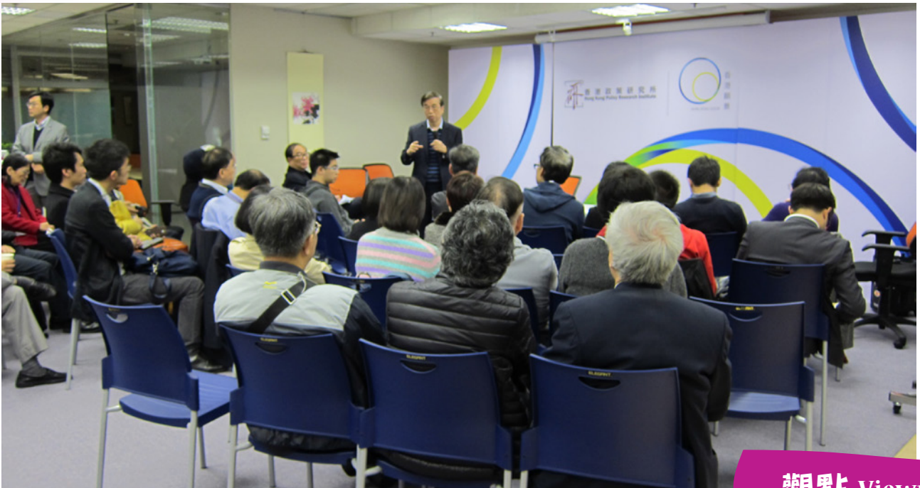
座談會吸引多人參與 Many people attend the talk