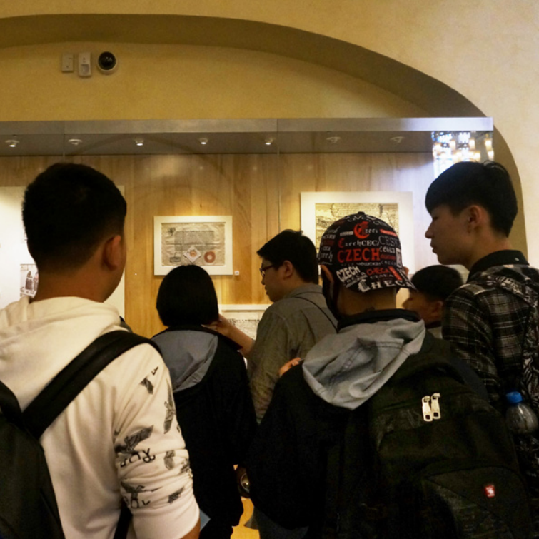
學生參觀猶太教會堂裏的展覽 Students see the exhibition in a Jewish synagogue

疊，遺體之上復又埋下遺體，共有十二層之多。在添加新的泥層時，猶太人通常會先挖起原有的墓碑，然後把它們搬到最上面的一層。於是，我們眼前的墓碑雜亂無章地擁擠在一起，甚至東歪西倒。這個寧靜而奇特的畫面有力地刻劃出猶太人的處境，帶着學生進入這個主題的總結討論——納粹大屠殺為甚麼發生？