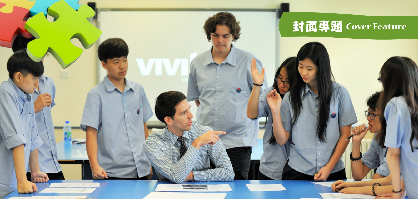
主動學習 Eager to learn