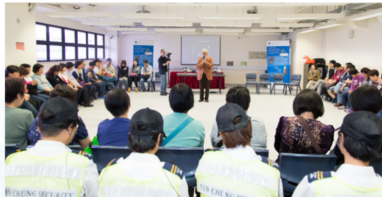
在活動開始前先進行祈禱 Prayer before staff training session

翻譯：楊文軒《民胞物與》實習生 Translated by: Timothy Yeung, MBWY Intern