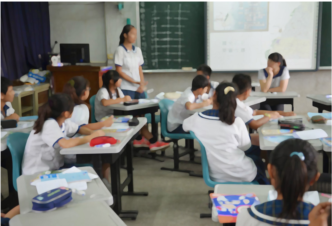
其他地區的學習共同體 Learning community practised in another region

about the world. In addition, the definition of “school” is no longer confined to being a place for education. Instead, it would be more accurate to call it a place that creates an atmosphere to learn through multiple means. This can be achieved by preserving “emptied” time and space for learners to think, explore, interact, imagine, try, fail, express, create, etc. In a learning community, learning is unrestrained by time and space. It can happen here, there, and everywhere. Teachers do more than teaching; they also act as learners and researchers. The success of a learning community lies on the ability of teachers to learn with students and to enjoy the process together. It is only with such teachers, that students will gradually come to discover the happiness of exploratory learning.