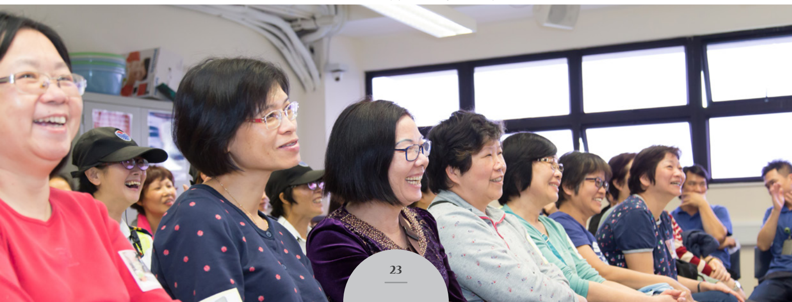
現場氣氛既輕鬆又愉快 Staff enjoys a relaxing and happy atmosphere

有見及此，耀中教育機構於今年四月，特意為校務部和中央廚房部的員工度身訂造培訓，借此提升他們的歸屬感，塑造一個更愉快的工作環境。機構人力資源總監馮囑賢女士在接受訪問時說：「是次活動的重要目的，是讓校務部和中央廚房部的員工體會到，他們對學校運作和學生都有着重要的價值。」