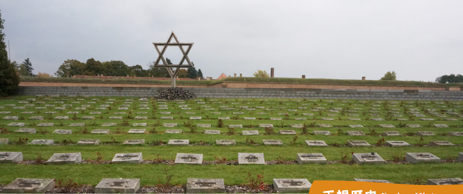
國家公墓 National Cemetery