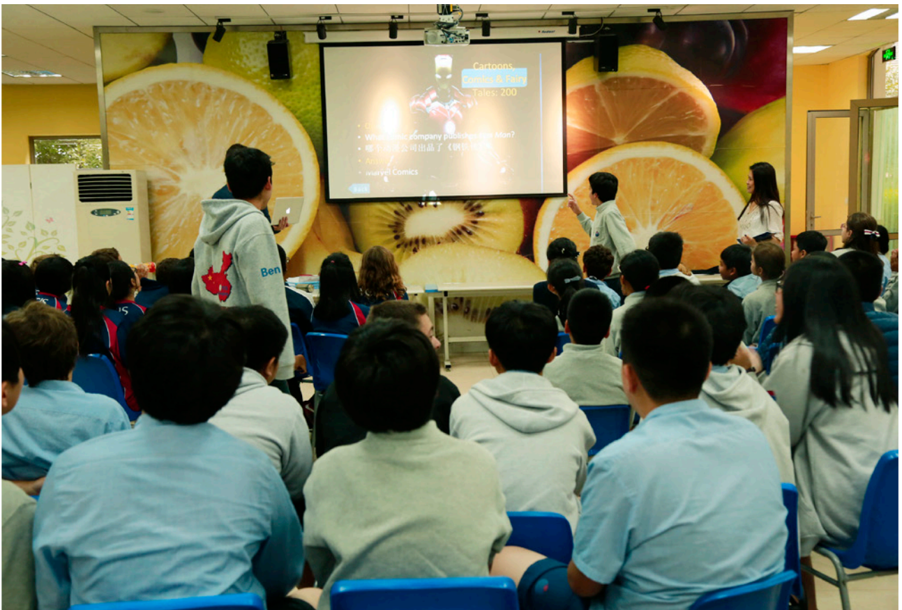
學生投入課堂 Students actively participate in the class

Fielding Nair International (FNI) is a globally leading planning and architectural design firm based in the US. Its team has done work in 45 countries on six continents. Schools that they planned and/or designed have won 11 international planning and design awards for excellence. The firm is praised not just for quality architecture, but vastly improved educational outcomes as well. They call themselves architects and educators as they are committed to building sustainable, high-performance schools and they would help clients plan, design and accomplish their school reform.