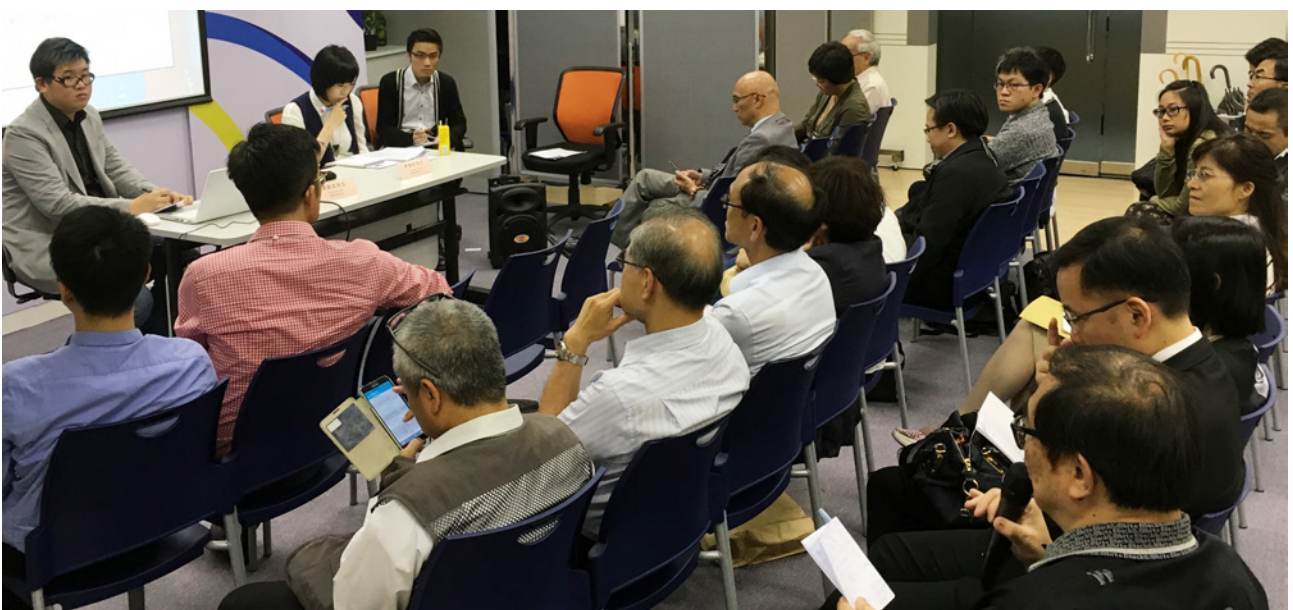
答問環節 Q & A Section