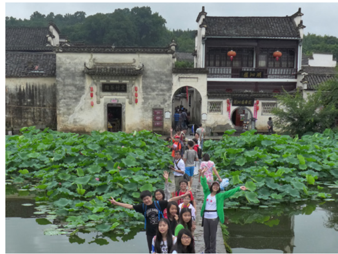
學生在中國教室行程中探索古村落 Students explore an ancient village during a China Classroom trip

到黃山學而酒店視察後，創辦人葉國華教授與陳保琮博士明確提出，酒店除作為保華生活教育集團的中華文化學習基地，還要辦成「中國教室」遊學行程的活動基地。葉教授也寄望把黃山學而辦成學習型的文化酒店。