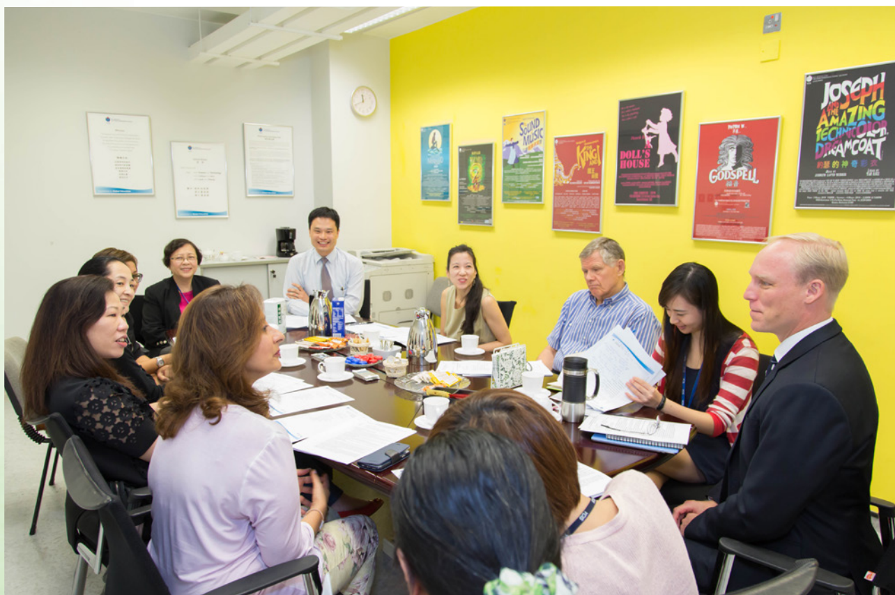
老師與家長合作 Teachers and parents work together

學習共同體的另一個特色，就是不受級別和班別人數的限制。呂博士解釋道：「大組學習與小組學習各有其特色和重要性，而學習共同體就能提供非常靈活的彈性。在教師有良好的協作和溝通氣氛的前提下，有需要時大組上課，隨時又拆成小組協作學習，就能回應不同的學習需要和學生學習差異。」