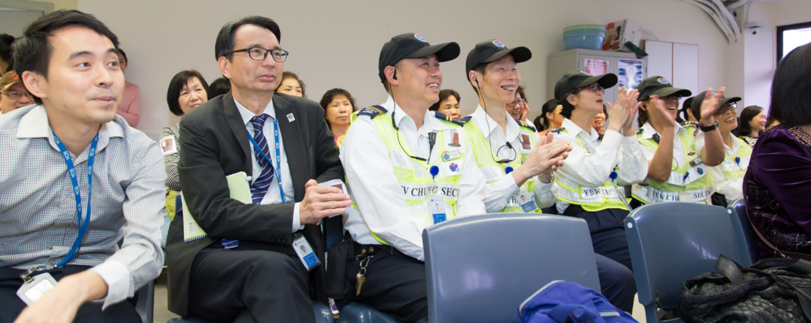
保安人員亦有參與活動 Security guards participate in the event