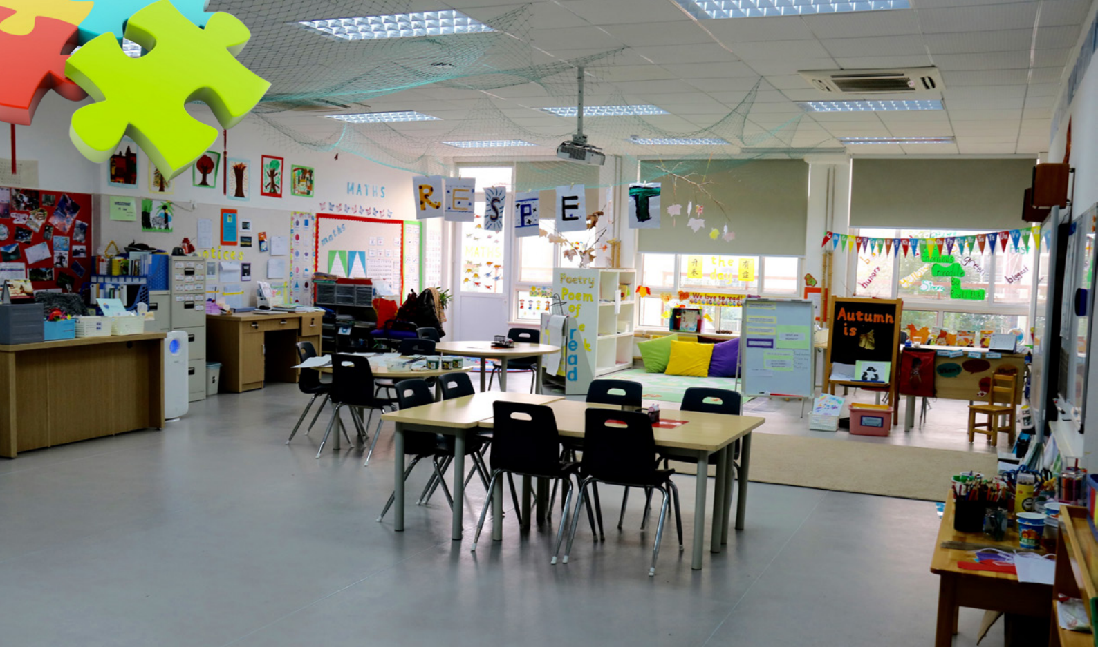
寬敞的學習空間 Spacious learning area