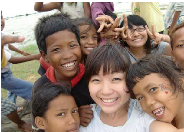
義工與小孩打成一片

第一屆「墨子計劃」在 2011 年舉行。經過篩選後，四隊共十九人的義工團隊已經於去年暑假期間先後抵達不同國家服務。十九位「墨子精神大使」分別來自香港大學、香港中文大學及香港專業教育學院，服務的國家包括尼泊爾、墨西哥、柬埔寨及迦納。他們已於同年十月「完成任務」順利返港，以下更是他們與我們分享的點滴心得：