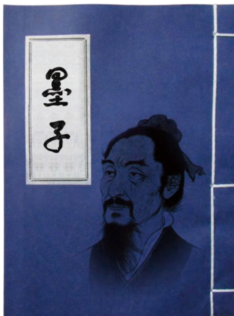
《墨子》乃墨翟之著作

民主與用人為才是現代社會獲廣泛接受的概念。墨家指出「官無常貴，民無終賤」。提倡「尚賢」。考慮到戰國時代掌權的主要是各國貴族，這個意念可說是大膽創新。尚賢的理念的伸延就是「不因貴賤親疏，唯才是用」。在現代的環境下，國家選拔管治人才靠的是民主與用人為才。因此，尚賢也可以用來回應現代的管治理念。