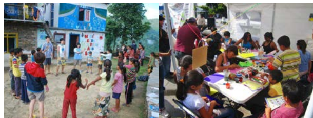
義工的主要活動是與小朋友一起玩團體遊戲和製作小手工

這是為期兩個月的義工服務。義工們到了孤兒院探訪，與小朋友玩遊戲，同時亦與當地的志願團體合作，舉辦工作坊，進行義教及宣揚個人衛生與健康的常識，並會協助他們興建學校及修葺村屋等。