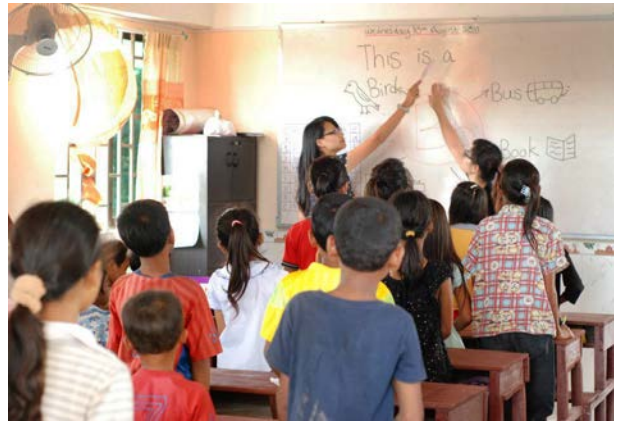
義教英文，學習的時候