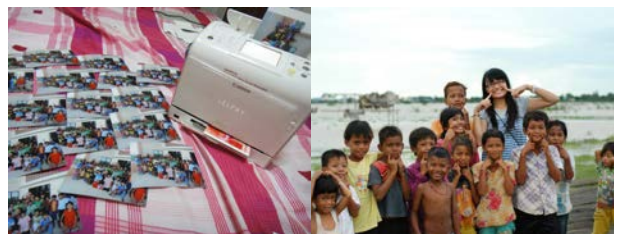
義工與當地小孩拍的照片

這是一個為期十五日的義工服務，取名「Camera」因為義工們會與當地小孩拍照並送贈留念，讓他們儲起珍貴的回憶，同時亦到了 SCAO 學習中心教授英文及和學童玩遊戲等等。