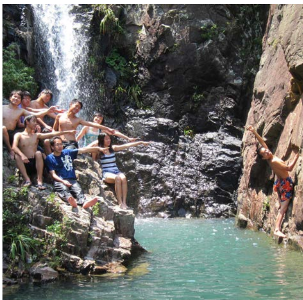
與大自然接觸在天水圍亦能夠做到

過往三年，Roundtable Community 的全人培育先導計劃已成功帶領逾百位天水圍青年走出圍城，服務社區內超過三千名居民，以生態文化深度遊方式欣賞大自然之美。本計劃將於月內出版活動結集，以總結為社區結網之成功經驗，並於全港學校作免費派發。本計劃為社區投資共享基金資助計劃。