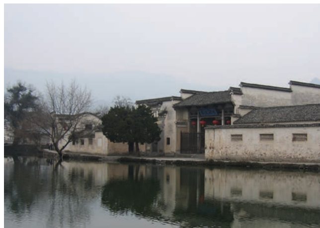
▲ 黃山市宏村前的池塘

鄉村旅遊的一個較成功的例子，是休寧縣的宏村。宏村始建於南宋紹興年間（1131-1162年），距今已有近千年歷史。村內建築屬於典型徽派風格，並在2000年成為世界文化遺產。宏村雖然是黃山市的熱門旅遊點，卻是一條「活」的村。村內仍然住有三百多