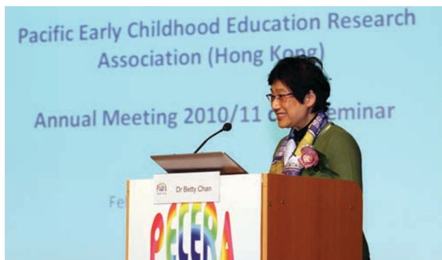
▲ 幼兒教育研究會周年會議

太平洋區幼兒教育研究學會(香港)周年會議暨研討會 - 2011年2月26日 Pacific Early Childhood Education Research Association (Hong Kong) Annual Meeting cum Seminar – 26 February 2011