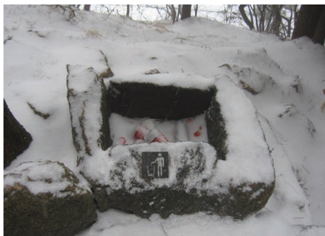
▲ 垃圾箱的設計刻意配合天然環境