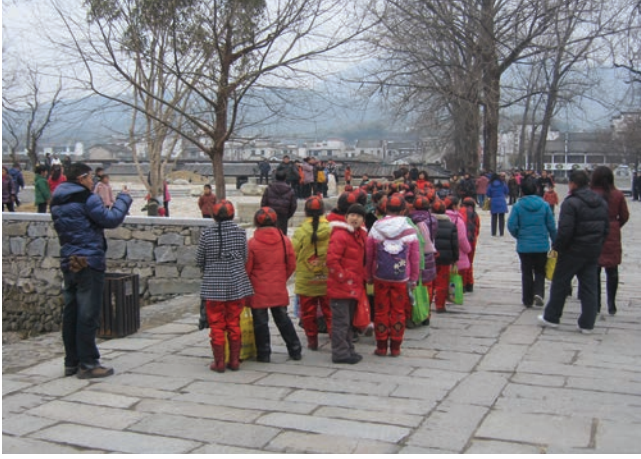
▲ 過多的遊客會影響古蹟的歷史價值