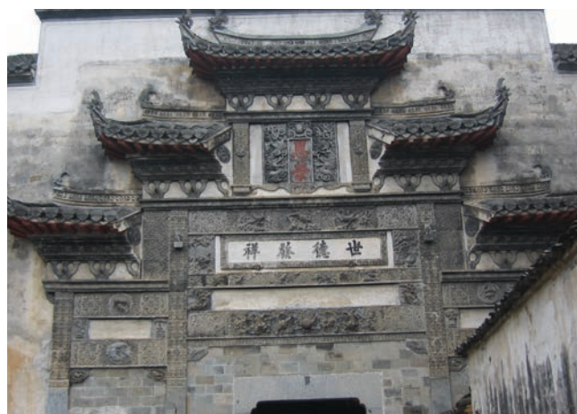
▲ 宏村所保留的典型徽派建築風格：石雕

戶，接近一千三百多名村民。宏村的建築，全都是保留着原有的容貌，商業活動盡可能減至最低，只有村民必須的商業（例如銀行）及少量精品販賣和民宿。宏村並沒有因開發為旅遊點而成為廢村，村民可以自給自足，依靠旅遊業為生之餘，保持村的生命活力，充分發揮鄉村旅遊的好處。