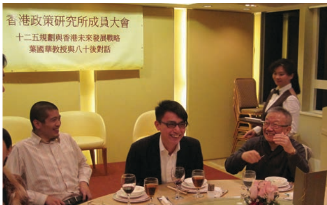
▲ 耆青兩輩，談笑風生

香 港政策研究所成員大會暨週年晚餐會 - 2011年1月11日 HKPRI AGM cum Annual Dinner & Dinner Talk – 11 January 2011