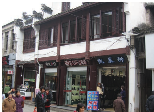
▲ 徽州古城內商舖林立

Ecotourism is a concept aimed to strike a balance between eco-environment protection and tourism. The local governments of Mount Huangshan and the City of Huangshan have implemented different policies in practicing ecotourism in order to conserve its natural scenery and cultural richness. The City of Huangshan advocates the development of Village Tourism, by which villages or communities that are of historical value are encouraged by the local government to rebuild and reconstruct, while keeping the communities as less commercialized as possible. At Mount Huangshan, different facilities such as railings and garbage bins are specially designed not to affect its natural scenery. However, due to the increasing number of visitors to Huangshan every year, and the area's heavy dependence on tourism, ecotourism will be facing greater challenges ahead.