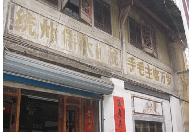
▲ 文化大革命對古蹟做成的傷害

是，徽州古城除了石坊、城牆及少量建築是原有之外，大部份都是後期加建的仿古物。更甚者是，古城內的主要街道兩旁全都是販賣各類商品的店舖，非常商業化，失去古味，成了一個本地人聚集的市場。即使城內有歷史價值的建築或景點，都被人們冷落。例如陶行知紀念館，內裡空空如也，風頭都被店舖搶光。