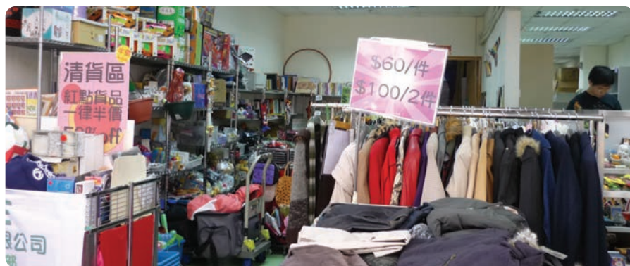
▲零售二手貨品的民企特賣場

相對於香港，外國的社企就比較多元化，處理的社會問題亦廣泛得多，解決弱勢社群失業問題只是其中一種。外國有些社企是從事推廣文化或者處理環保問題，而這些社企是必定要虧本的。因此，她們需要政府的優惠政策，例如稅務優惠、租用土地的優惠、直接資助等等，以不同的方式去支援這些社企的生存。香港的社企就只是集中於解決勞工問題、失業問題，而未有開拓社企解決其他社會問題的潛力。