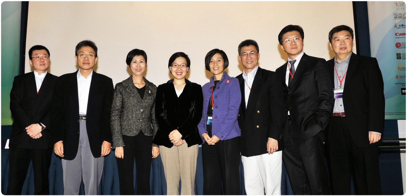
▲ 社企民間高峰會專題討論：民、官、商、學如何攜手推動社企發展

經驗中改進自己。李正儀認為，社企的發展有賴社會各界人士的參與，尤其是商界以及專業人士。例如在去年的高峰會中，便有分享商界與社企合作的楷模：這個社企辦的是給有需要的長者安裝平安鐘。有甚麼方法可以接觸到一些獨居長者？社企的負責人想到與煤氣公司合作，讓煤氣公司職員上門抄錶的時候，同時了解到是否有獨居長者需要平安鐘的服務。對煤氣公司來說，這只不過是舉手之勞，但對獨居長者來說，卻是莫大的裨益。由此可見，商界與社企有很多合作的空間，而這些合作的機遇也是可藉著社企民間高峰會的交流而營造。高峰會藉著邀請政府、商界、學界、社會企業和社福團體等共同討論，提供了平台讓社會各界連結，為發展社企營造更好的環境。「現在，就連臺灣和內地的團體都表示要來參加，吸收經驗做好本地的社企。」李博士道。因此，社企民間高峰會所提供的平台，不單是本地的跨界別合作，更是跨區域的交流和合作了。